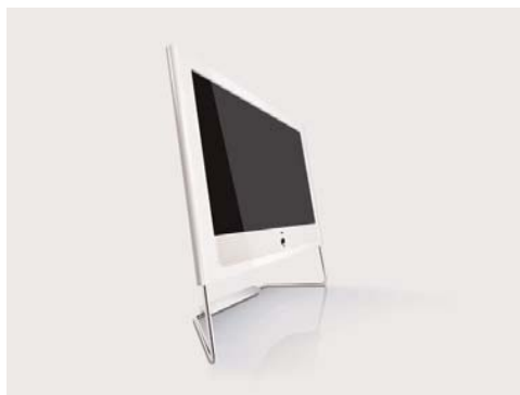
Beispiel für einen neuen Flachbildschirm von Loewe

Die Bildschirme der preislich höheren Geräte werden ab heuer eine Dicke von nur noch 3 cm haben und mit LED-Lampen hinterleuchtet. Dadurch steigt erfreulicherweise der Kontrast und die Tageslichttauglichkeit. Ob sich aber das dreidimensionale TV oder OLED-TV (eine neue Schirmtechnologie)