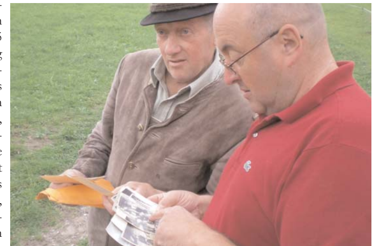
Das Befragen vieler Einheimischer und das Sichten alter Dokumente waren notwendig, um ein authentisches Filmdokument zu gestalten.