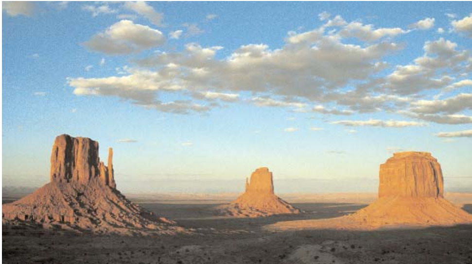
Das Monument Valley mit seinen Felstürmen ist als Navajo Reservat echtes Indianerland

Wer kennt sie nicht, die kahlen, roten Felstürme des amerikanischen Westens, die nicht nur in Wildwestklassikern wie „Spiel mir das Lied vom Tod“ einen dramatischen Hintergrund abgegeben haben. Schon die Namen der einzelnen Staaten, Utah, New Mexico, Arizona, Colorado sind Programm. Eckhard Nussmüller hat sich im Wilden Westen umgeschaut.