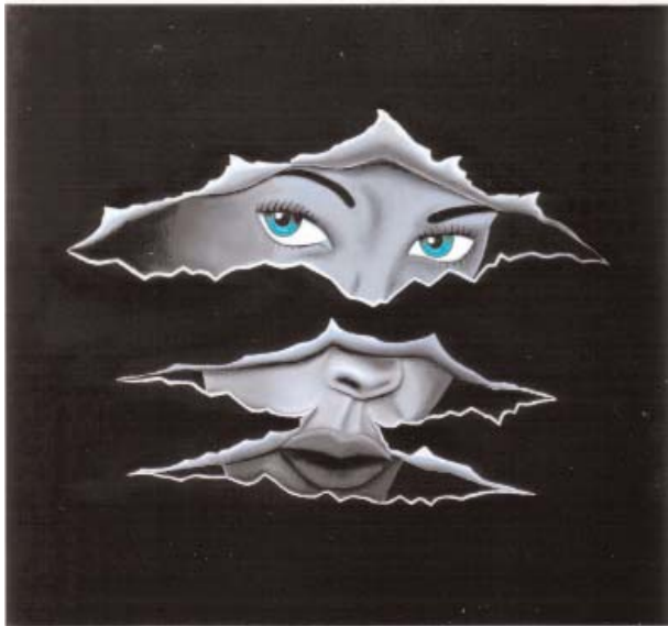
S-W-G, Öl auf Leinwand, 50 x 70 cm, 2007

Brauchumsabhandlung im „Reibeisen“ Kulturmagazin Kapfenberg, Titelseiten des Gemeindeblattes der Evangelischen Pfarrgemeinde Kapfenberg, Maturaballdekoration im Volkshaus Kindberg, Gestaltung des 24. Dezembers (Adventkalender) in Mitterdorf, Layout der Broschüre 10 Jahre Galerie Oberegger und die Betreuung der Homepage der Galerie Oberegger.