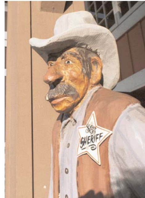
Kein Wildwestfilm ohne Sheriff!

gerät unser Film rasch zu einer einschläfernden Bildershow. Also müssen wir uns eine Rahmenhandlung zurechtlegen, und dann genau das tun, was schon Regisseure wie John Ford getan haben - die Landschaft als Stimmungsmacher nützen. In den weiten, staubigen Ebenen werden Menschen klein und unbedeutend. In den Canyons wird jede Stimme unnatürlich verstärkt. Kakteen und Organ Pipes gleichen in ihren Silhouetten einem Menschen und selbst ein geübtes Auge kann in dieser weiten, schier unendlichen Landschaft hinsichtlich Entfernung, Größenverhältnisse und räumlicher Zuordnung getäuscht werden. Es sind also ideale Voraussetzungen für eine mystische