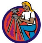
Schwere Dreibeinstative sind auf Reisen nicht gerade beliebt