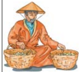
Vergessen sie nicht, die Menschen des jeweiligen Landes in die Geschichte einzubeziehen

Selbstverständlich wollen die meisten mit leichtem Gepäck unterwegs sein. Wer schleppt schon gerne stundenlang eine schwere Schulterkamera durch Venedig? Die kleinen DV-Camcorder gibt es schon seit Jahren auch in 3-Chip-Ausführung und sind den größeren und schweren Schwestern durchaus ebenbürtig. Sie sind wie geschaffen für den Reise-film. Die nächste Frage betrifft das Stativ. Grundsätzlich kann man sagen, dass jeder Filmer, der ernst genommen werden möchte, immer zu einem Stativ greifen sollte. Es gibt natürlich Filme, bei der die Handkamera nicht nur nicht stört sondern geradezu unentbehrlich ist. Etwa bei einer rasanten Reportage. In den meisten Fällen sind verwackelte Bilder aber eher nicht gefragt. Nun, was ist da zu tun? Ich meine, es gibt