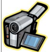
Minicamcorder lassen sich ausgezeichnet verbergen und belasten nicht das Urlaubsgepäck