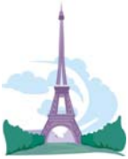
Die Reisezeit ist angebrochen