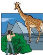
Erschlagen sie den Zuseher nicht mit einer Masse an Informationen!

Wenn man zum ersten mal in ein Land kommt empfiehlt es sich sehr, sich schon lange vorher in Büchern, Vorträgen oder via Internet genau zu informieren. Dabei findet man vielleicht Informationen über eine Besonderheit dieses Landes, ein Ereignis, ein typisches Fest, ein spezielles Handwerk oder ähnliches. Auch wenn die Reise quer durchs Land führt, ist es meist besser, nur einen kurzen aber interessanten Film über ein ausgewähltes Thema zu drehen als einen langen, langweiligen Reise-schinken. Solche Themen sind auch besser überschaubar und einfacher zu planen. Erschlagen sie ihre Zuseher nicht mit einer Masse an Information. Wer merkt sich schon Jahreszahlen, Städtenamen, Kaiser und Könige aus der Geschichte des Landes? Wen interessiert das wirklich? Ein kurzer, prägnanter Kommentar mit Witz und Ironie oder, bei einem ernsten Thema eini-ge treffende Worte wirken nachhaltiger. Wer seine Reise unbedingt präzise dokumentieren möchte, hat dank Video, immer die Möglichkeit, aus der Menge des mitgebrachten Materials mehrere Filme zu gestalten.